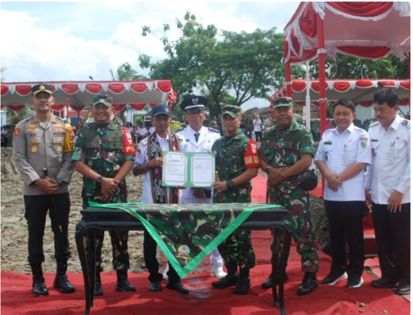
Komando Distrik Militer (Kodim) 0716/Demak menggelar upacara pembukaan TNI Manunggal Membangun Desa (TMMD) Reguler ke-123 Tahun 2025

DEMAK - Komando Distrik Militer (Kodim) 0716/Demak menggelar upacara pembukaan TNI Manunggal Membangun Desa (TMMD) Reguler ke-123 Tahun